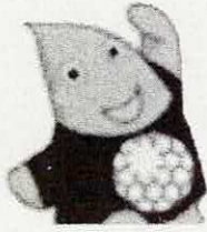
大和市イベントキャラクターヤマトン