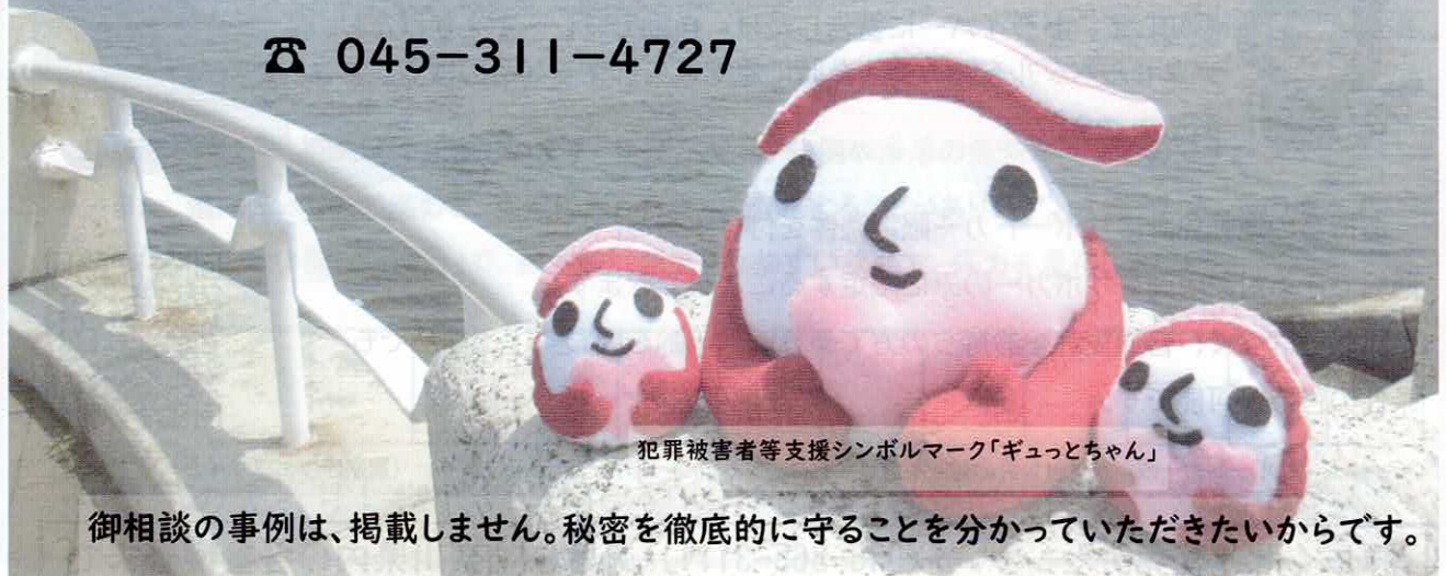
犯罪被害者等支援シンボルマーク「ギュっとちゃん」