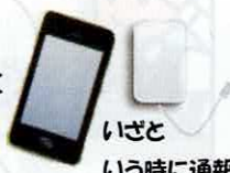
携帯電話と予備電池