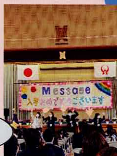
こんにちは一年生