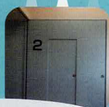
非常扉の色が フロア毎に違います！